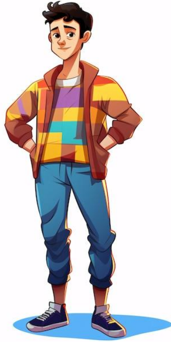
Ergen Tüm aile bireylerinin söz hakkı olmalıdır.