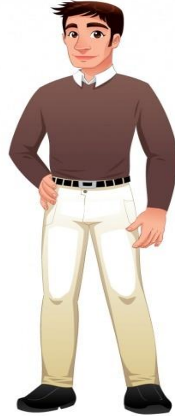
Baba Toplantı düzenli aralıklarla tekrarlanmalıdır